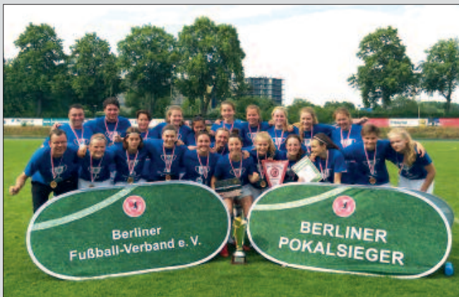
■ Die B-Mädchen wurden Berliner Pokalsieger. Die Fußballerinnen bestechen immer wieder durch spannende Szenen.

Das könnte sogar Modellcharakter haben: „Mir ist in der Region kein einziger Förder-