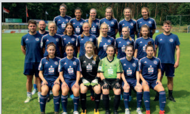
■ Mit Unterstützung durch den neuen Förderverein wollen die Spielerinnen von SV Blau-Weiß Hohen Neuendorf wieder in die Bundesliga aufsteigen.