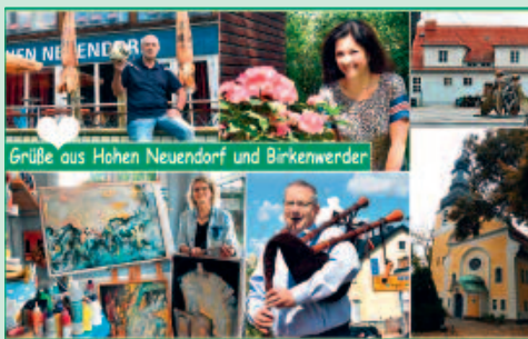
Grüße aus Hohen Neuendorf und Birkenwerder