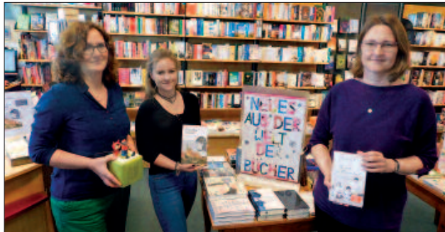
■ Je nach Wunsch findet man in der Buchhandlung Behm konventionelle oder digitale Bücher.

Ein wichtiger Schwerpunkt sind Schulbücher, die auf Wunsch eingebunden werden. In der Reihe „Lese-genuss nach Ladenschluss“ werden regelmäßig interessante Neuerscheinungen vorgestellt. Die Buchhandlung bildet gern aus und bietet Schülerpraktika an.