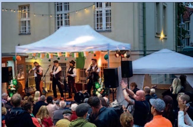
■ Das Rathausfest hat sich zu einer Tradition entwickelt, die Besucher weit über Birkenwerder hinaus anzieht.

„Das Motto war Brasilianische Nacht“, schmunzelt der ungewöhnliche Instrumentalist. Wenig später, beim Weihnachtsmarkt, den der Verein mit zur Zeit beachtlichen 50 Mitgliedern ebenfalls ins Leben gerufen hat, bleibt die Pfeife wieder zu Hause: „Hier bin ich als Weihnachtsmann zwar mit einem Sack unterwegs, aber der dudelt nicht!“ Also gilt es für Fans, warten bis zum Anknippen!