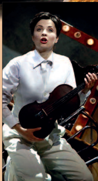
■ Eine ihrer Spezialitäten sind „Hosenrollen“.

I m Schatten der hohen Berge, abgeschlossen vom Trubel, da schlummert es, das Talent.