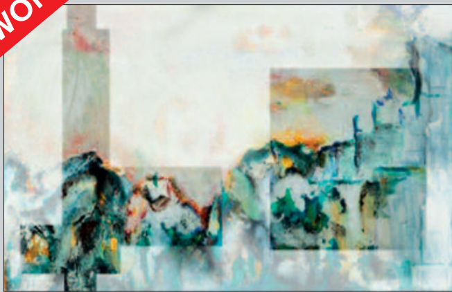
Gudrun Eiser lässt die Psyche auf die Leinwand springen