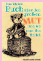
■ Mirjam Strube